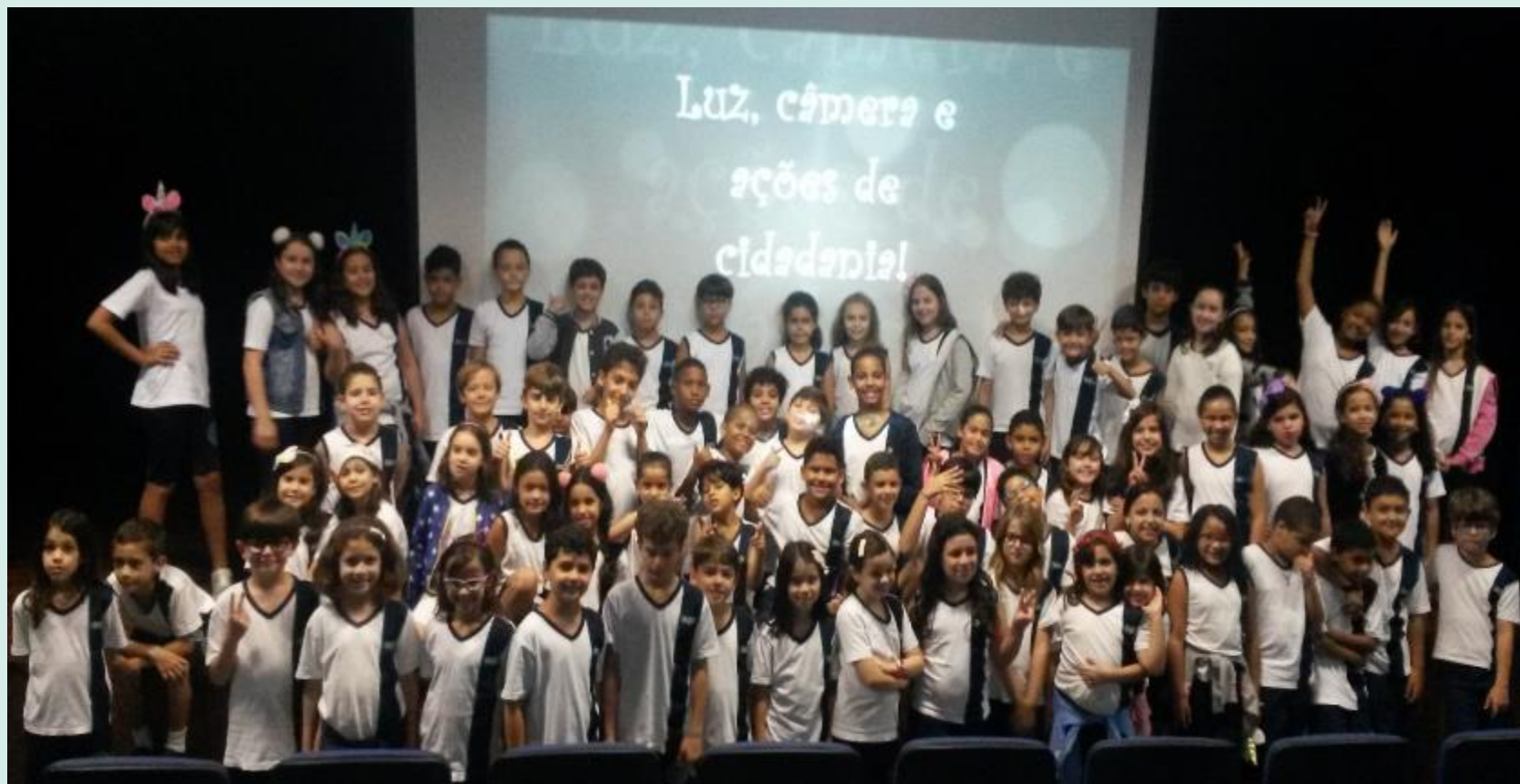
Foto da Turma